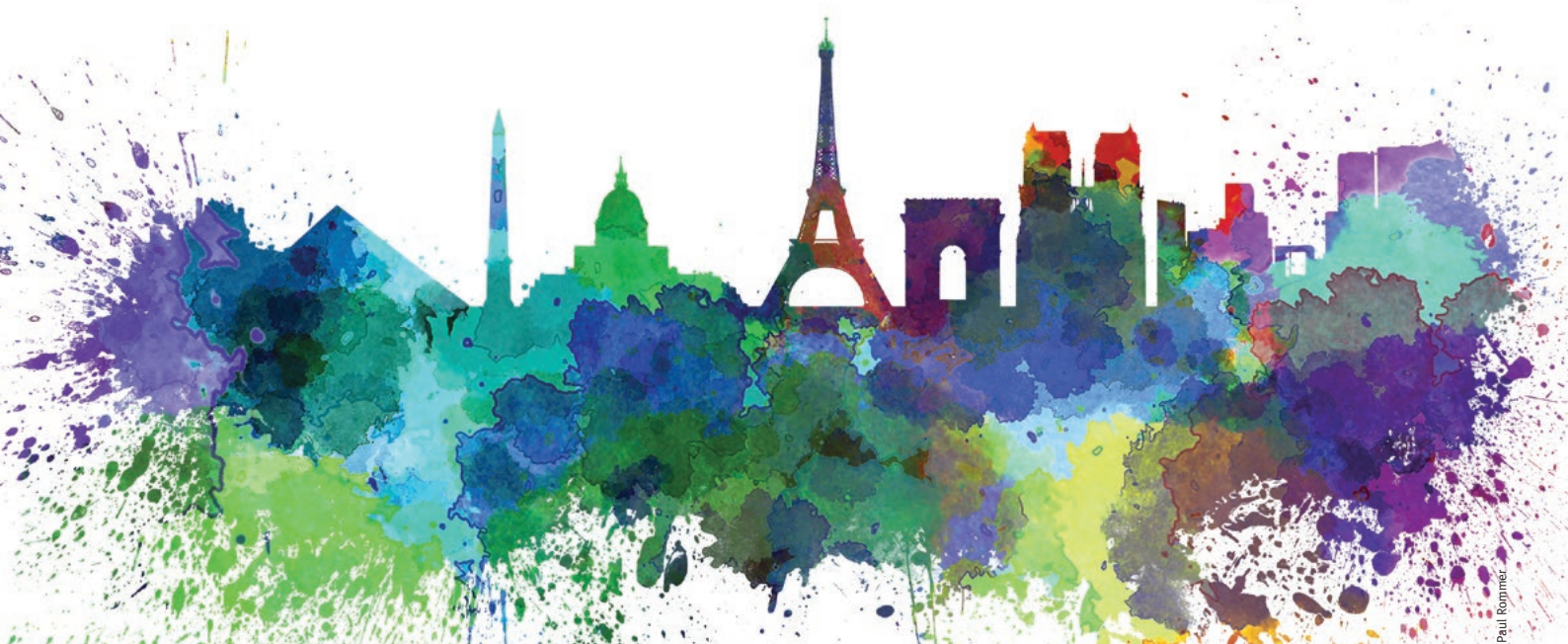
Illustration: Paul Rommer

STIFTUNG UMWELT UND ENTWICKLUNG NORDRHEIN-WESTFALEN