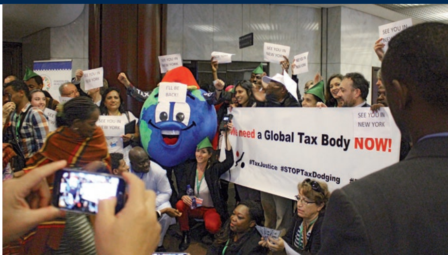
Wir lassen uns nicht unterkriegen! NRO-Aktion zum Abschluss der Konferenz in Addis Abeba