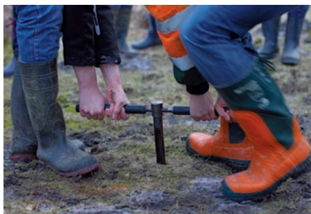
Bodenproben und Schlammuntersuchungen: Bundesfreiwillige lernen, wie es geht.

➔ Weitere Informationen unter www.nrw.nabu.de/spenden-und-mitmachen/mitmachen/freiwilligendienst , www.freiwillige-im-naturschutz.de sowie in unserer Projektdatenbank unter U-3434