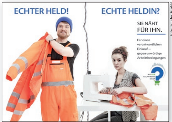
Diese Protestpostkarte, weitere Karten und Materialien aus dem Projekt „Wie fair kauft meine Stadt?“ können bei der Christlichen Initiative Romero bestellt werden.

Als Hauptgrund dafür sehen sie die fehlende Kontrolle. Dies erschwert im Übrigen auch die Arbeit der Beschaffungsstellen: Fehlende Überprüfbarkeit und Überforderung bei der Einholung der notwendigen Erklärungen wurden mit 90 und 94 Prozent als Hauptursachen für die schwierige Umsetzung des TVgG genannt.