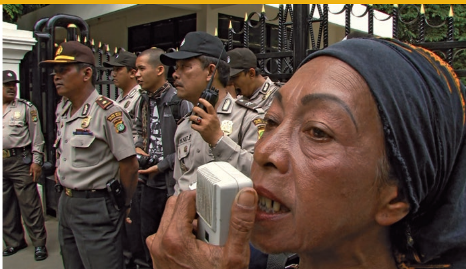
Szene aus „Jakarta Disorder“, Gewinner des Eine-Welt-Filmpreises 2015

Die Gewinner des Eine-Welt-Filmpreises werden alle zwei Jahre im Rahmen des „Fernsehworkshop Entwicklungspolitik“ ausgewählt. Die Preise (5.000, 3.000, 1.000 Euro)