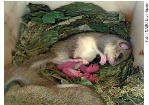
Siebenschläfer mit Jungen

Quirlige Mieter für Luxusappartement gesucht: So heißt es auf der Internetseite des NABU Leverkusen unter der Rubrik „Angebote für Siebenschläfer“. Die so Angesprochenen ließen sich die Chance nicht entgehen. In einem Wald bei Leverkusen bezogen sie Meisenkisten, die von ihren Vormieter verlassen wurden. Seit Mitte Juni lässt sich das Leben der Siebenschläfer live auf der Internetseite www.nabu-leverkusen.de verfolgen – von der Geburt der nur 5 Gramm schweren Jungtiere bis zu den ersten eigenen Gehversuchen.