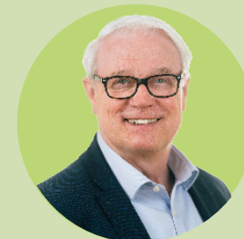
Oliver Krischer Minister für Umwelt, Naturschutz und Verkehr des Landes Nordrhein-Westfalen